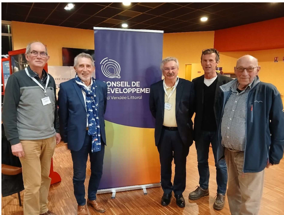
Le Bureau du Conseil de développement Sud Vendée Littoral.